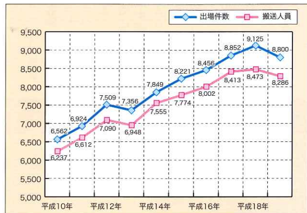
過去10年間の救急推移